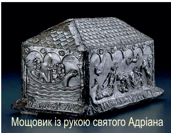
Мощовик із рукою святого Адріана